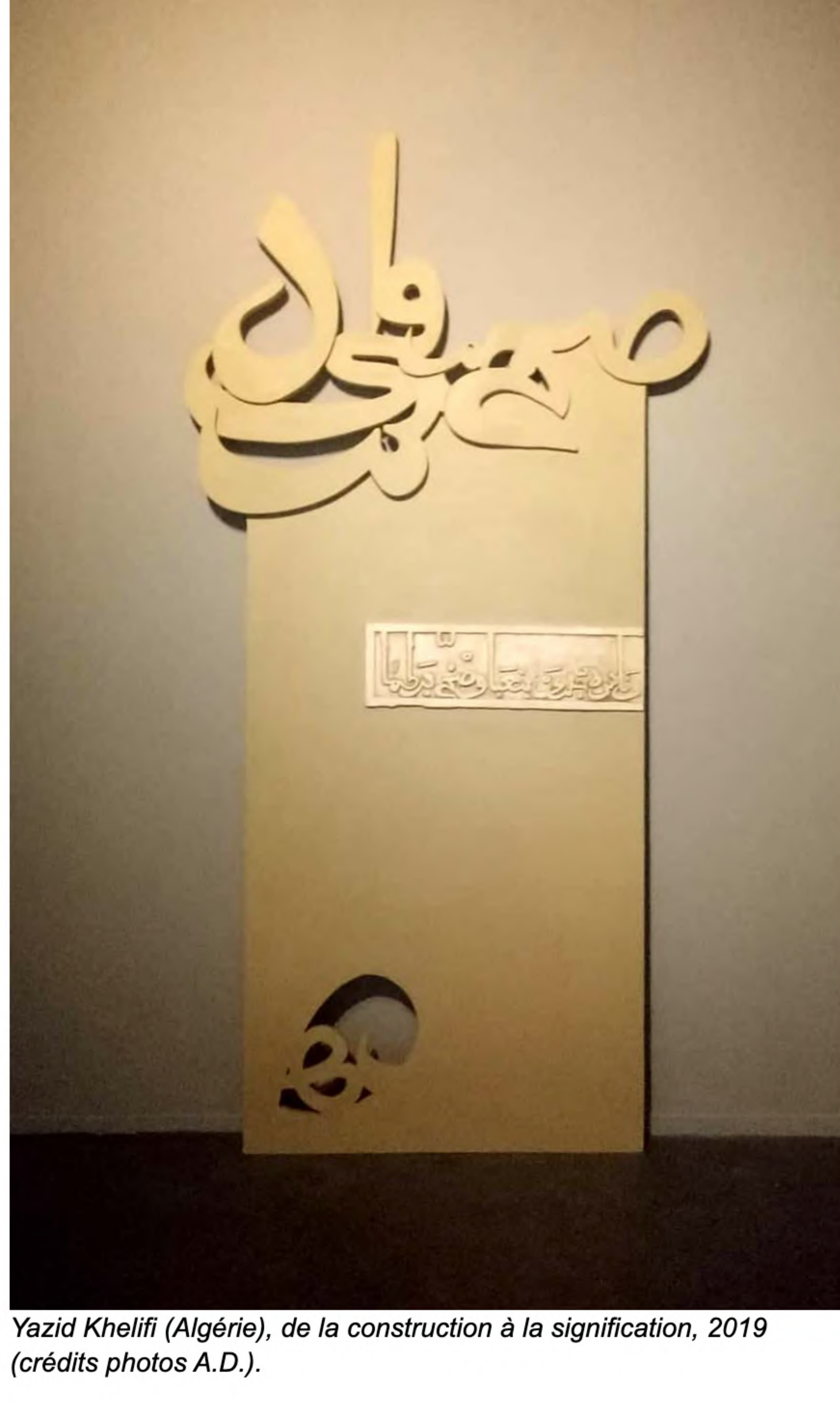
Yazid Khelifi (Algérie), de la construction à la signification, 2019.