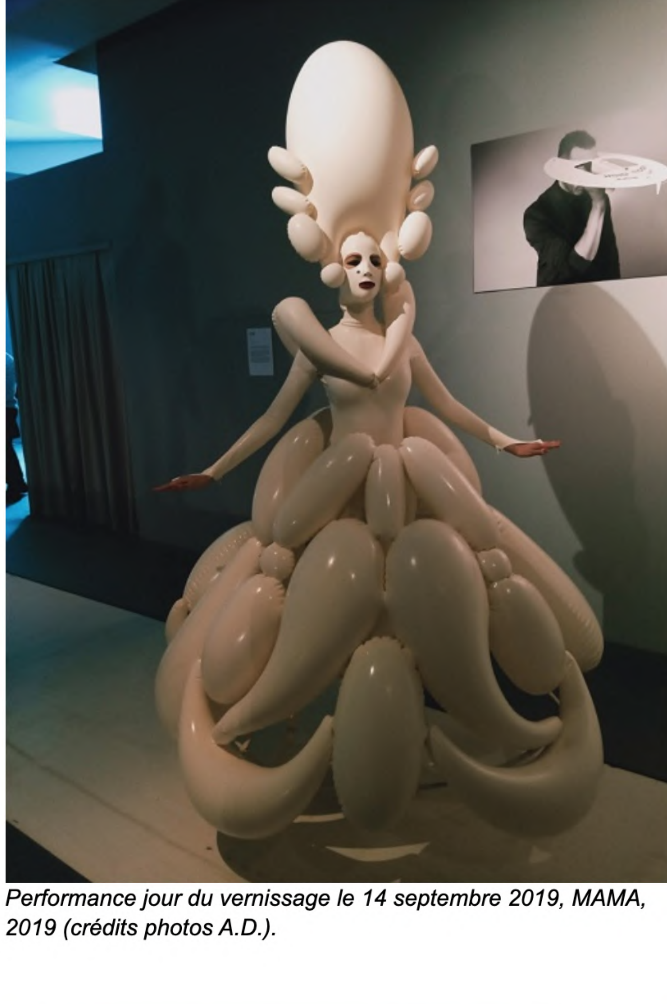
Performance jour du vernissage le 14 septembre 2019, MAMA, 2019.