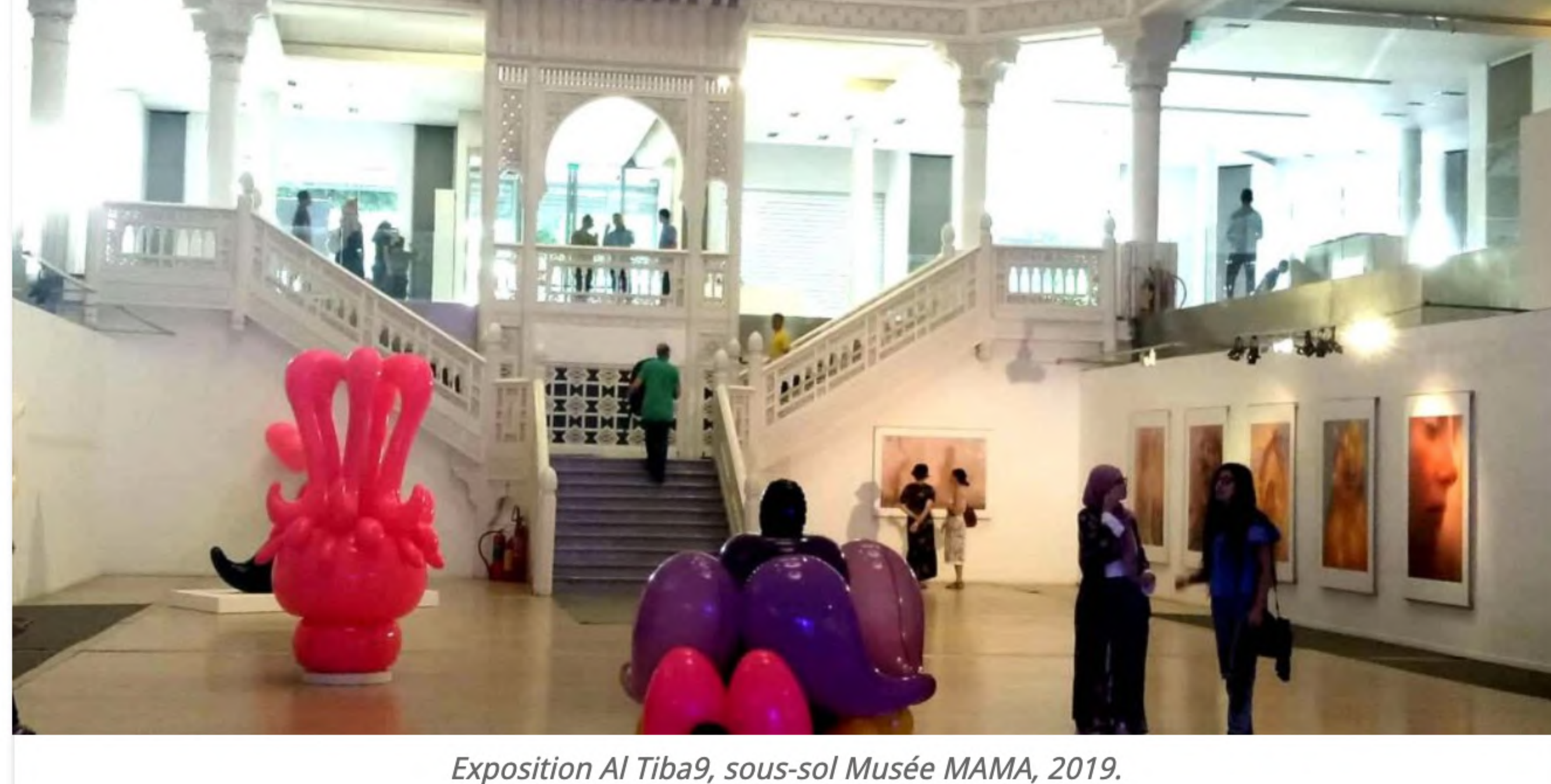
Exposition Al Tiba9, sous-sol Musée MAMA, 2019.

Accueil > actualités > Al Tiba9 une 7e édition au MAMA